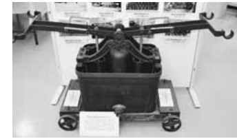
▲火工廠の消火ポンプ

歴史展示室2の近代の展示のなかに、大丸の火工廠多摩火薬製造所で使われた消火ポンプがあります。