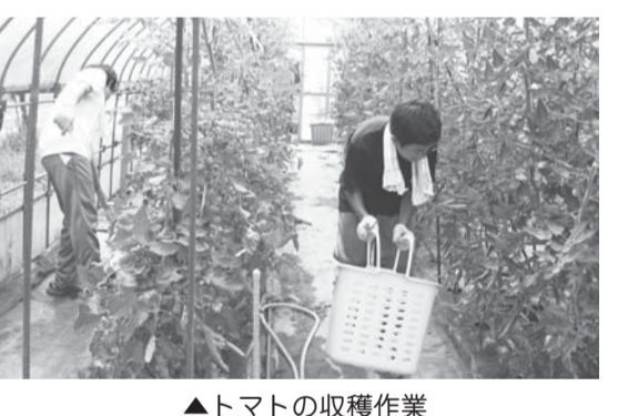
▲トマトの収穫作業

本校では「学ぶ意欲のある生徒の育成」をテーマとした校内研修を行っています。具体的には以下の3つの観点から研究を推進しています。