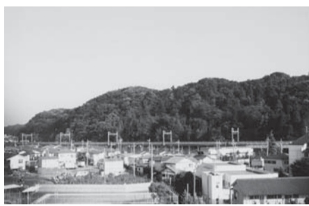
▲矢野口付近の多摩丘陵

です。標高差は実に約130mもあります。郷土資料室コーナーでは、このような稲城市の地形について、写真や説明パネルを使って紹介しています。ぜひご覧ください。