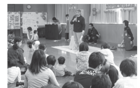
▲「子育て応援フェスタ2009」の様子

第6回子育て応援フェスタ2010 「みんなで子育て、世代をこえて」 育児に奮闘中のみなさんと交流して、地域の輪をつくりませんか?楽しいイベントが盛りだくさんなので、ぜひ遊びに来てください。 ▽期日 11月14日(日) ▽時間 午前10時~正午(開場9時半) ▽対象 乳幼児親子・これから出産予定の方、子育てを支援したい方 ▽会場 第四文化センター ▽入場料 無料 ▽申込み 不要。当日直接お越しください。 ▽問合せ 第四公民館