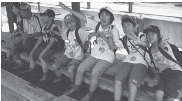
▲足湯につかっていい気持ち

そして、しばらく登るとそれまで見えていた村が、眼下に広がっていることに気付き、子供たちは景色の美しさや、今いる場所の高さを感じながら、これから5日間の宿泊体験学習への思いを強めていきました。