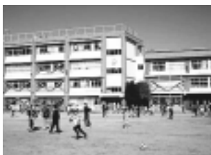
校庭で遊ぶ児童たち