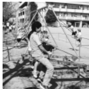
遊具で楽しむ児童たち