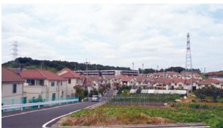
当自治会地域の街並み

このように歴史的には浅い自治会ですが、周辺の他自治会と連携を取りながら、防災や安全など、住みやすい環境を整えていくことを課題と考え活動していきたいと考えておりますので、よろしくお願いします。