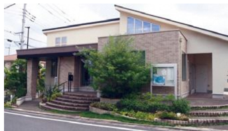
活動の拠点となる自治会館