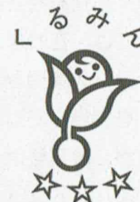
▲次世代認定マーク くるみん

現行法では、行動計画を策定・届出し、一定の要件を満たすと、厚生労働大臣の認定（くるみん認定）を受けることができます。今回の改正では、このくるみん認定を受けた企業のうち、特に次世代育成支援対策の実施状況が優良な企業に対する新たな認定制度（特例認定）が創設されます。