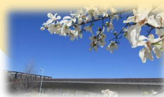
写真：春のくじら橋

福祉くらしの総合窓口は、市民のみなさまの悩みを受けとめ、共に解決するために設置された、稲城市の総合相談窓口です。 生活の悩みは、多様化、複雑化しています。わたしたちは、どのようなご相談であってもしっかりと聞かせていただき、豊富な経験と専門性をもって、皆様と共に解決を目指していきます。