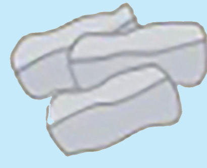
コークス炉 化学原料化