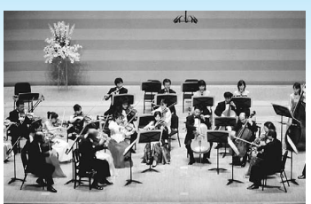
▲日本フィル・メンバー

事業の詳細・チケット購入・講座申込み方法は、稲城市立プラザホームページ ( http://www.iplaza.inagi.tokyo.jp/ ) 及び市内公共施設に置いてある「プラザインフォメーション」をご参照ください。△問合せ 稲城市立プラザ ☎331-1720 ▷託児申込・問合せ(マザーズ): 0120-788-222(平日10時～正午/13時～17時)