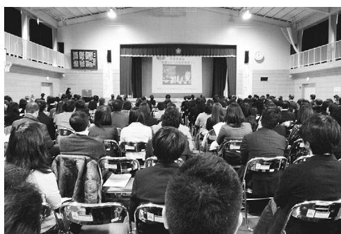
▲来校者が450名を超えた研究発表会