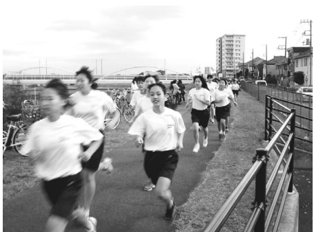
▲稲城第四中学校マラソン大会の様子

この大会には、たくさんの方々に携わっていただきました。稲城市陸上競技協会、稲城市総合型地域スポーツクラブ「イクラブ」、東京ヴェルディトライアスロンセッション、東京都立若葉総合高等学校陸上競技部、