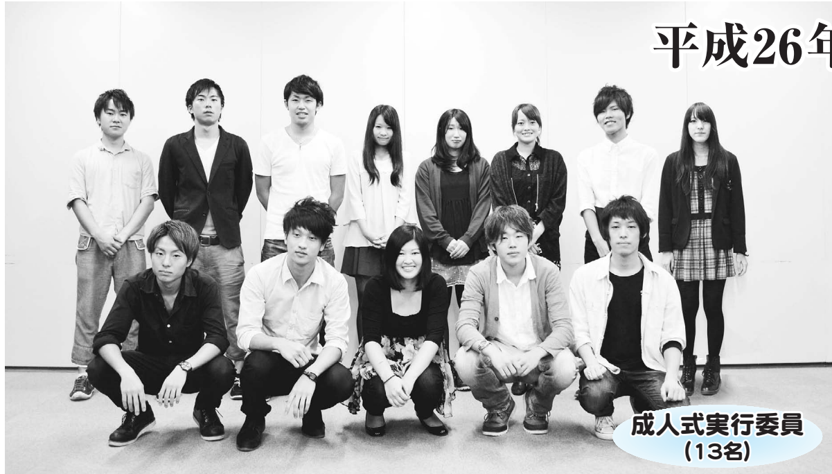
成人式実行委員 (13名)

1月13日(月・祝)に駒澤学園記念講堂で稲城市成人式を開催しました。今年は男性448名、女性431名、合計879名が新たに大人の仲間入りを果たしました。新成人を代表して、式典の企画・運営に携わった成人式実行委員13名のなかから6名の抱負や思いをご紹介します。