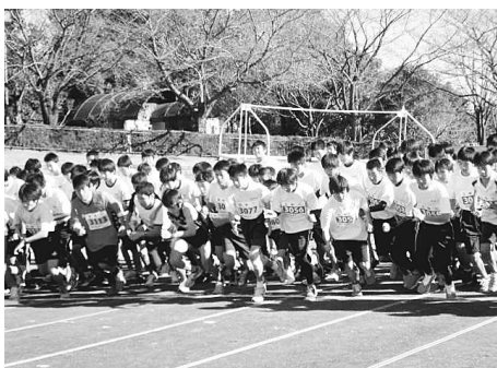
▲中学校連合ロードレース大会の様子

「挑戦」「団結」「躍進」「限界突破 稲城」をスローガんに、全員で響をつなげます。ご声援よろしくお願います。