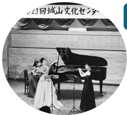
▲練習の成果をステージで(昨年度)

編集・発行 稲城市教育委員会教育部生涯学習課 〒206-8601 稲城市東長沼2111 ☎042-377-2121 042-379-0491