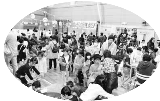
▲楽しい児童館まつり(昨年度)

※一部内容が変更になる場合があります。詳しくは、まつりチラシ・児童館だよりでご確認ください。