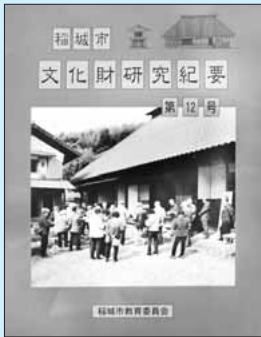
▲文化財研究紀要 第12号