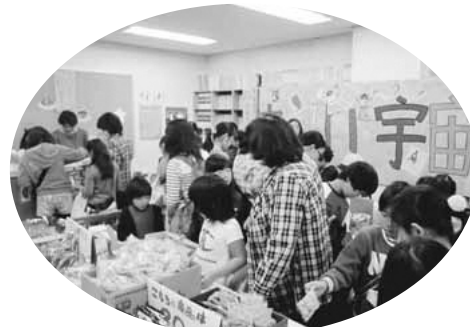
▲楽しい児童館まつり(昨年度)

※一部内容が変更になる場合がございます。詳しくは、まつりチラシ・児童館たよりでご確認ください。