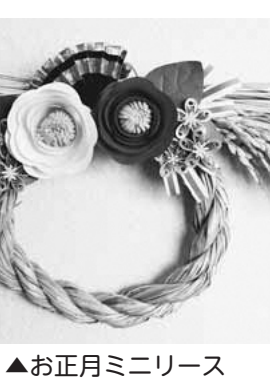
▲お正月ミニリース