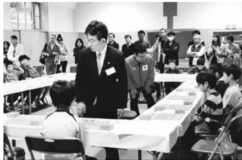
▲指導中の佐藤康光九段

※教室は申込制となります。氏名、年齢、性別、住所、連絡先を記載し、申込フォーム、FAX又は直接管理棟受付にお申し込みください。 ※申込フォームは稲城長峰ヴェルディフィールドHP「教室・イベント」ページにございます。(HPの教室情報は毎月15日に更新いたします) ※②レディースサッカーDayは最低開催人数を8名以上といたします。