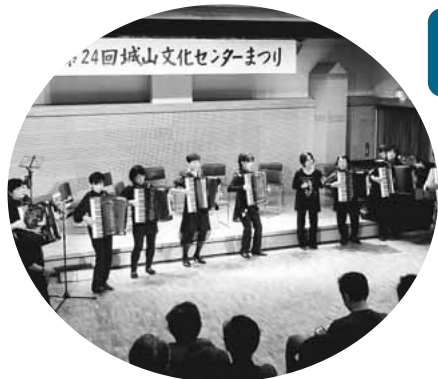
▲練習の成果をステージで(昨年度)

編集・発行 稲城市教育委員会教育部生涯学習課 〒206-8601 稲城市東長沼2111 ☎042-377-2121 042-379-0491