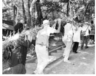
▲完成した大蛇を担ぎ上げる

ますのでご紹介いたします。 「江戸時代初めの寛文2年に疫病が大流行しました。村人たちはなんとこれを防ぐかと考えました。妙見尊は妙見様が青龍にのって天下り、この地にあらわれたという言い伝えがこの歴史の古い神社です。この言い伝えを思いおこした村人たちは、みんなで青龍をつくるおまつりすれば疫病が村