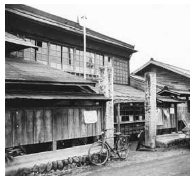
▲稲城村役場(昭和31年撮影)

明治21年(1888)4月、市制・町村制が公布され、翌22年4月から順次施行されました。この制度は、地方制度の確立にむけて、町村合併により財政能力・行政能力をもった有力な市町村をつくりだすことを目的としたものでした。 稲城市域の村々では、この当時、東長沼村外五か村連合戸長役場の管轄下にありましたが、明治22年4月1日、東長沼村・矢野口村・大丸村・百村・坂浜村・平尾村の六か村は、町村制の公布に伴う町村合併により合併しました。 新しく誕生した「稲城村」でしたが、行政事務を担う村役場の建物はまだありませんでした。合併当初は、常楽寺や報恩寺(明治末廃寺)など近隣の寺院の建物を借りて、村役場や村議会の事務がおこなわれていました。