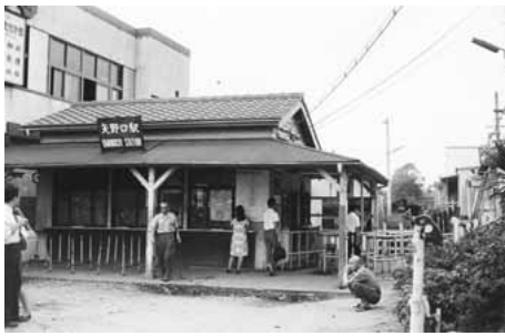
▲南武線の矢野口駅(昭和42年撮影)

郷土資料室では、いなぎ発信基地へアテラス(南武線稲城長沼駅前)▽内容 稲城の風景写真等の古写真を中心として、稲城の移り