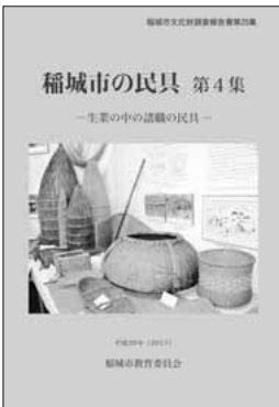
▲『稲城市の民具第4集』