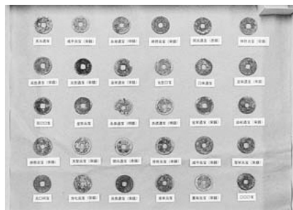
▲入定塚出土の銅銭

平尾地区南部の川崎市境に中世の時代に築かれた入定塚があります。入定とは、仏教の僧侶が経文を唱えながら塚の中で修行し仏の世界に入ることと言います。