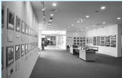
▲前回の昆虫展の様子