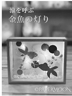
手作りライト作品例