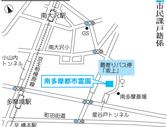
南多摩都市霊園案内図

【電車】京王相模原線「南大沢」駅下車 タクシーで約2km 約5分 バス 「南大沢」駅経由「相模原」駅行き「坂上」バス停下車すぐ ※バスは平成24年9月現在、1日に6本運行しています。 【車】尾根幹線道路を稲城市役所から相模原方向に向かい、小田急「唐木田」駅を超え、立体交差側道の南多摩斎場入口交差点を左折し、南多摩斎場向かい側にあります。