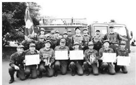
▲第一分団(矢野口地区)

第28回 稲城市消防団 消防操法審査会 実施結果 7月13日に実施された消防操法審査会について次のとおり順位が決定しました。 第一位 第一分団(矢野口地区) 第二位 第五分団(坂浜若葉台地区) 第三位 第二分団(東長沼地区) 出場された各分団とも日頃