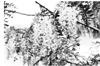
多摩川沿いのアカシア