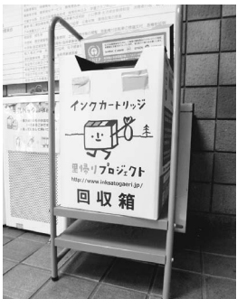
インクカートリッジ回収箱

市では、これらのインクカートリッジをリサイクルするため、市役所・出張所・文化センター・総合体育館・中央図書館などにインクカートリッジ専用の回収箱を設置しています。