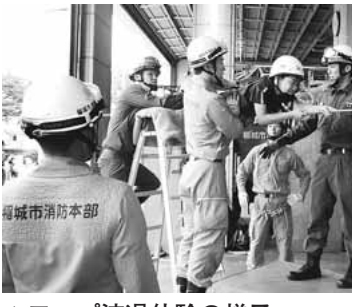
▲ロープ渡り体験の様子

少年消防クラブでは、防火・防災に関する知識を習得し、規律を学び社会に奉仕できる人材育成を目的に活動しています。 限9月16日(水) 限午前10時