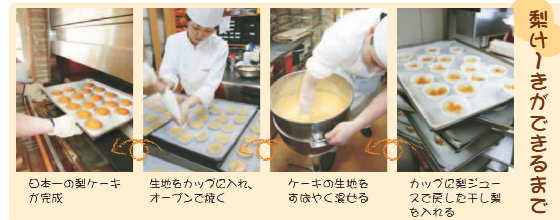
①日本一の梨ケーキが完成 ②生地をカップに入れ、オーブンで焼く ③ケーキの生地を、おはやく混ぜる ④カップに梨ジュースで戻した干し梨を入れる

ある時、移動中に駅弁を食べていると、ふとおかずの大き根に目が止まりました。「これだっ！」一瞬時が止まりました。 「大根は煮ると柔らかくなるけど、干すと切り干し大根や沢庵のように食感を出す事ができる。これを梨に応用できないだろうか。」 旅から戻り、すぐに干し梨を作ってみました。ただのドライフルーツでした。甘みは濃くなるが、梨だと言われなければ気がつかない。そこで、一晩水に漬けて戻した干し梨を食べてみると、なんと！梨のシャキシャキ感が戻り、甘み、香りも強くなっていました。 でも、水ではなく「稲城で生まれた梨ジュース」で干し梨を戻したらもっと良いのではないかと試行錯誤し、5年の歳月を費やして、ついに「日本一の梨ケーキ」が誕生したのであります。