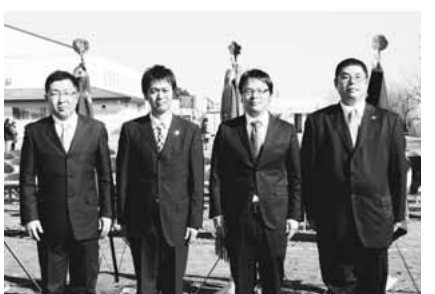
▲市長感謝状を受けた皆さん

稲城市消防団に対し、積極的に協力していただいた事業所、また消防行政の運営に対して協力し功績が顕著であった団体です。