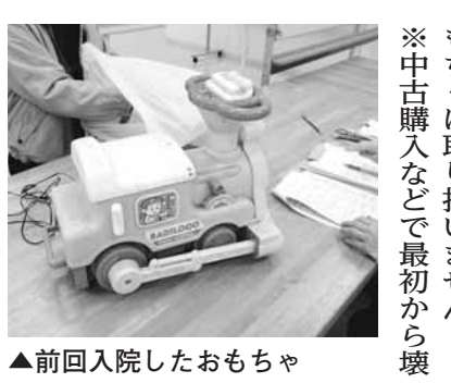
▲前回入院したおもちゃ

2月28日(土)開催 環境学習センター イベント 家で眠っているおもちゃありませんか 第3回おもちゃの病院 リユースの精神を育むために「おもちゃの病院」を開院します。当日は、症状を伺いますので、なるべくお子さんと一緒に壊れたおもちゃを持ってご来場ください。また、取扱説明書などがあればご持