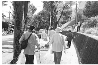
昨年の清掃活動の様子(平尾地区)