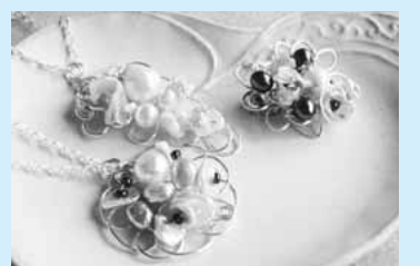
▲パールで上品なアクセサリーを作ります