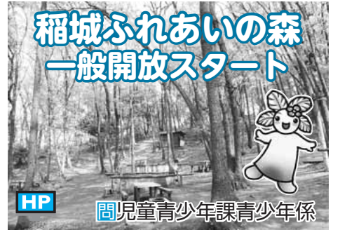
稲城ふれあいの森 一般開放スタート

稲城ふれあいの森では、豊かな自然の中で、散歩やバーベキューなどが楽しめます。▽一般開放期間 3月19日(土)～11月までの土・日曜日、祝日(7・8月は除く) 午前9時～午後4時 場下図参照 申不要(ただし、10人以上の団体は1週間前までに申し込みが必要です)