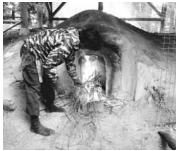
▲炭焼き体験の様子

稲城ふれあいの森では、豊かな自然の中で、散歩やバーベキューなどが楽しめます。▽一般開放期間 3月19日(土)～11月までの土・日曜日、祝日(7・8月は除く) 午前9時～午後4時 場下図参照 申不要(ただし、10人以上の団体は1週間前までに申し込みが必要です)