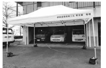
▲寄贈いただいたイベント用テント

HP イベント用品 ① イベント用テント(3.0m×4.5m)(2張) ② 餅つき機(2台) ③ 餅切り機(2台) ④ 主な貸出条件 ○ 青少年健全育成を目的に活動している団体 ○ 市内在住・在勤・在学者で構成された団体 ○ 団体の代表者が成人であること