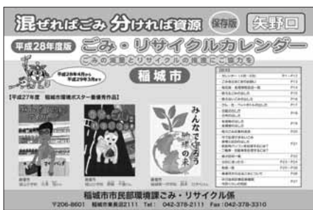
▲平成28年度版ごみ・リサイクルカレンダー

「無料で不用品を回収します」「家電・金属・工業製品の無料回収のお知らせ」と記載したチラシが市内でも出回っています。このような不用品回収業者に処分を依頼したところ「無料だと思って頼んだら、車に積んだ後で高額な料金を請求された」「業者が回収した物が不法投棄されていた」などの相談が各地の国民生活センターに寄せられています。また、こうした不用品回収業者に渡すと、適正なりサイクルがなされず、国内