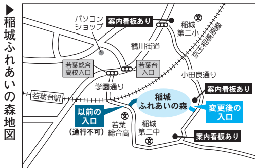
▶稲城ふれあいの森地図

▽禁止及び注意事項 ○野草摘み、虫捕り、飲酒、ペット同伴での入場、カラオケ等他人の迷惑となること ○天候不良や市主催事業等により、開放を中止する場合があります。開放日等詳細は、市HPをご覧ください。 炭焼き体験 一昨年焼いた炭を窯から取り出す作業と薪詰め作業が体験できます。取り出した炭はお持ち帰りできます。 3月20日(日・祝)