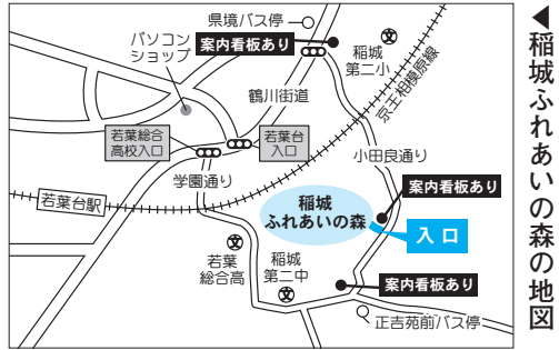
稲城ふれあいの森の地図