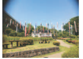
「端午の節句」 (稲城市フォトギャラリー投稿作品)

主な記事 ひとり親家庭等医療費助成制度 (4) 児童育成手当の所得審査の 対象年度が切り替わります (4) 固定資産税・都市計画税 (5) 5月12日は 民生委員・児童委員の日 (8)