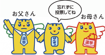
▲明るい選挙のイメージキャラクター 選挙のめいすいくん(中央)