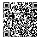
放課後子ども 教室だより

※毎月ホームページで公開している放課後子ども教室だよりには、プログラム活動の予定やお知らせが掲載されていますので、ご覧ください。